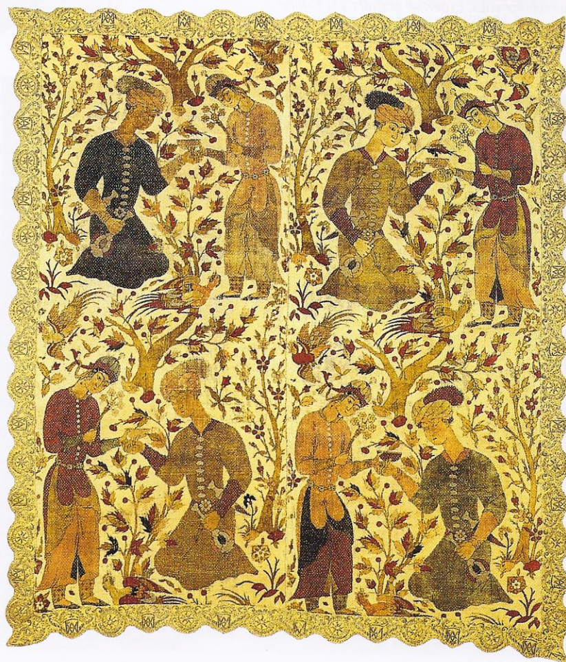
PERSE, QAZVIN, XVII e SIÈCLE, 156 X 137 CM, VENDU CHEZ SOTHEBY'S £793.500